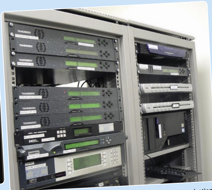
Les signaux sont traités ici. Les slots Tandberg sont pour des opérations satellite. Les slots pour les ondes radio terrestres relient avec SENTECH, le fournisseur de services africain pour la distribution de signaux.