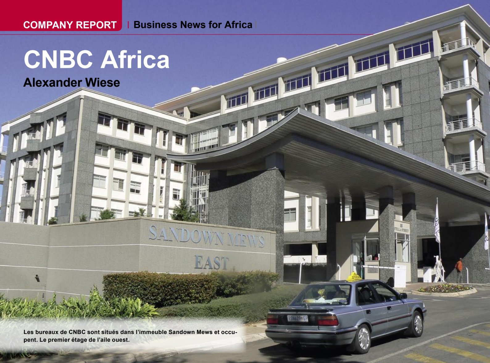
Les bureaux de CNBC sont situés dans l'immeuble Sandown Mews et occupent. Le premier étage de l'aile ouest.