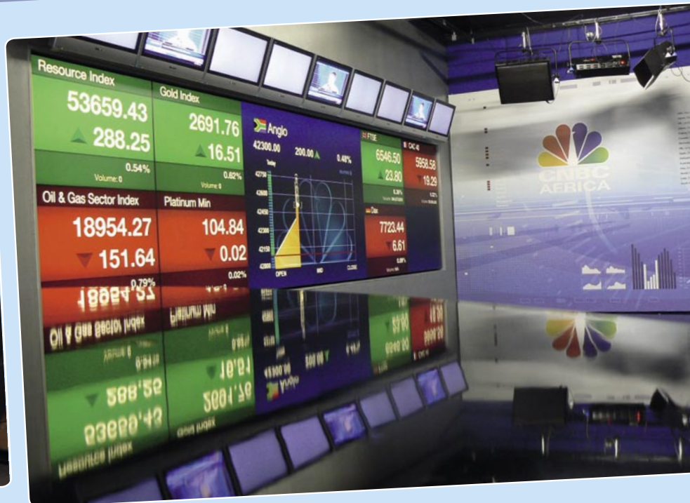
Une vue du studio de la CNBC Afrique.