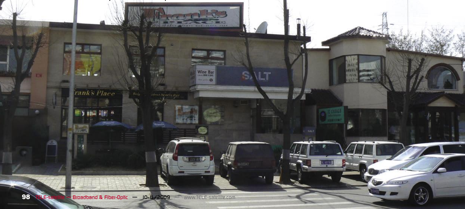
■ Un autre bar de sports : Le Frank's Place est le bar sportif le plus ancien de Pékin et a été ouvert en 1989. Grâce à Shalom, il y a également un choix tout à fait considérable d'émissions sportives ici aussi. Shalom nous donne les détails : « Sur le toit il y a une antenne de 2.4 mètres pour 68.5°E, une parabole de 1.8 mètre pour 166°E ainsi que deux antennes de 60cm, une pour 138°E et l'autre pour 146°E. »

dre. À côté de ses études il a également commencé à apprendre l'anglais. Il a fait une interruption en 1993 où il a été invité par un de ses ex-professeurs à passer une année à l'université centrale de Washington aux Etats-Unis et a été même invité à vivre dans la maison de ce professeur. Comme cette famille était juive et son nom chinois sonnait très semblable à Shalom, une salutation en hébreu, son nouveau surnom était trouvé aussitôt !